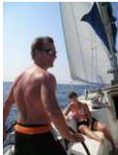
Aan het roer