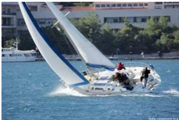
tijdens de Race

Het schip is een Sun Odyssey 51 gemaakt door Jeanneau, is een comfortabel en bijzonder ruim zeiljacht van ruim 15 meter lang. Het schip is van alle gemakken voorzien. Voor de gasten zijn er twee dubbele hutten achter met een eigen douche- en toiletruimte, twee hutten voor met twee/drie slaappleatsen en eigen douche- en toiletruimte, en een dubbele hut voorin het schip met toilet. Aan dek bevinden zich twee slaappleatsen boven de salon. Het riante teakhouten dek biedt daarbij nog voldoende ruimte voor degene die buiten wil slapen en wil genieten van een heldere sterrenhemel. Matrassjes hiervoor zijn aan boord aanwezig. De ruime kuip is voorzien van een